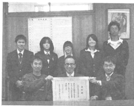
文部科学大臣表彰

会を担当していた教員が「生徒がひとつになつて取り組むためのキーワードとして考えたのが現在の本校のキャッチフレーズとなった「茨西PRIDE」である。また、学校提案型個性化推進事業（GP事業）で「茨西PRIDE」地域とともに大きくむ夢と志を」テーマとして生